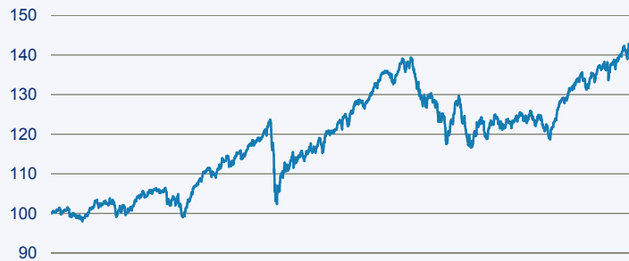
— Raiffeisen-Nachhaltigkeit-Mix - RZ VTA EUR

Risiko: Die in der Vergangenheit erzielte Performance und die Ertrage lassen keinen Ruckschluss auf die zukunftige Performance und die Ertrage des Fonds zu. Der Fonds ist weder mit einer Garantie noch mit einem Kapitalschutzmechanismus ausgestattet. Der in Euro umgerechnete Wert internationaler Anlagen des Fonds kann infolge von Wechselkursschwankungen (Wahrungsschwankungen) sowohl steigen als auch sinken. Der Wert des Fonds und damit der Wert ihres Investments kann gegenuber dem Einstandspreis steigen oder fallen.