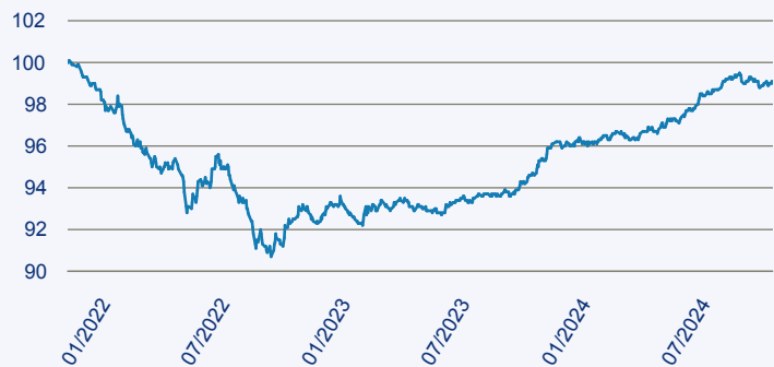
— Dimensional Funds Global Sustainability Short Fixed Income Fund EUR Acc

Risiko: Die in der Vergangenheit erzielte Performance und die Erträge lassen keinen Rückschluss auf die zukünftige Performance und die Erträge des Fonds zu. Der Fonds ist weder mit einer Garantie noch mit einem Kapitalschutzmechanismus ausgestattet. Der in Euro umgerechnete Wert internationaler Anlagen des Fonds kann infolge von Wechselkursschwankungen (Währungsschwankungen) sowohl steigen als auch sinken. Der Wert des Fonds und damit der Wert ihres Investments kann gegenüber dem Einstandspreis steigen oder fallen.