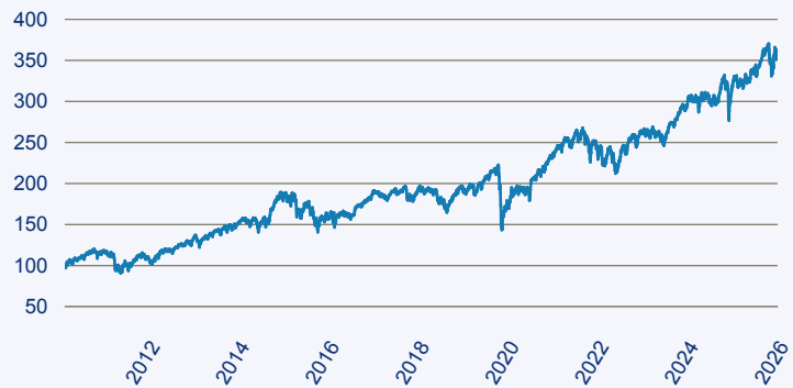
— Vanguard Investment Series PLC - Vanguard ESG Developed Europe Index Fund E

Risiko: Die in der Vergangenheit erzielte Performance und die Ertrage lassen keinen Ruckschluss auf die zukunftige Performance und die Ertrage des Fonds zu. Der Fonds ist weder mit einer Garantie noch mit einem Kapitalschutzmechanismus ausgestattet. Der in Euro umgerechnete Wert internationaler Anlagen des Fonds kann infolge von Wechselkursschwankungen (Wahrungsschwankungen) sowohl steigen als auch sinken. Der Wert des Fonds und damit der Wert ihres Investments kann gegenuber dem Einstandspreis steigen oder fallen.