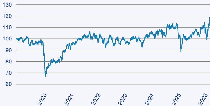
— Stewart Investors Global Emerging Markets Leaders Fund I (Accumulation) EUR

Risiko: Die in der Vergangenheit erzielte Performance und die Ertrage lassen keinen Ruckschluss auf die zukunftliche Performance und die Ertrage des Fonds zu. Der Fonds ist weder mit einer Garantie noch mit einem Kapitalschutzmechanismus ausgestattet. Der in Euro umgerechnete Wert internationaler Anlagen des Fonds kann infolge von Wechselkursschwankungen (Wahrungsschwankungen) sowohl steigen als auch sinken. Der Wert des Fonds und damit der Wert ihres Investments kann gegenuber dem Einstandspreis steigen oder fallen.