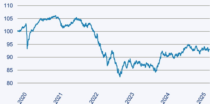
— Dimensional Global Core Fixed Income Lower Carbon ESG Screened Fund EUR A

Risiko: Die in der Vergangenheit erzielte Performance und die Erträge lassen keinen Rückschluss auf die zukünftige Performance und die Erträge des Fonds zu. Der Fonds ist weder mit einer Garantie noch mit einem Kapitalschutzmechanismus ausgestattet. Der in Euro umgerechnete Wert internationaler Anlagen des Fonds kann infolge von Wechselkursschwankungen (Währungsschwankungen) sowohl steigen als auch sinken. Der Wert des Fonds und damit der Wert ihres Investments kann gegenüber dem Einstandspreis steigen oder fallen.