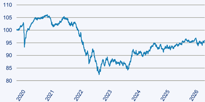
— Dimensional Global Core Fixed Income Lower Carbon ESG Screened Fund EUR A

Risiko: Die in der Vergangenheit erzielte Performance und die Ertrage lassen keinen Ruckschluss auf die zukunftige Performance und die Ertrage des Fonds zu. Der Fonds ist weder mit einer Garantie noch mit einem Kapitalschutzmechanismus ausgestattet. Der in Euro umgerechnete Wert internationaler Anlagen des Fonds kann infolge von Wechselkursschwankungen (Wahrungsschwankungen) sowohl steigen als auch sinken. Der Wert des Fonds und damit der Wert ihres Investments kann gegenuber dem Einstandspreis steigen oder fallen.