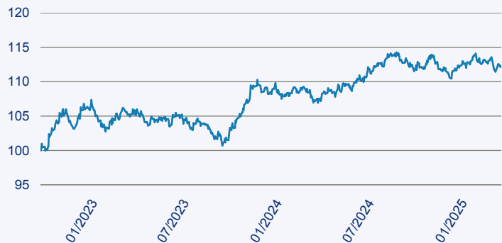
— Vanguard ESG Global Corporate Bond Index Fund EUR Hedged Acc

Risiko: Die in der Vergangenheit erzielte Performance und die Erträge lassen keinen Rückschluss auf die zukünftige Performance und die Erträge des Fonds zu. Der Fonds ist weder mit einer Garantie noch mit einem Kapitalschutzmechanismus ausgestattet. Der in Euro umgerechnete Wert internationaler Anlagen des Fonds kann infolge von Wechselkursschwankungen (Währungsschwankungen) sowohl steigen als auch sinken. Der Wert des Fonds und damit der Wert ihres Investments kann gegenüber dem Einstandspreis steigen oder fallen.