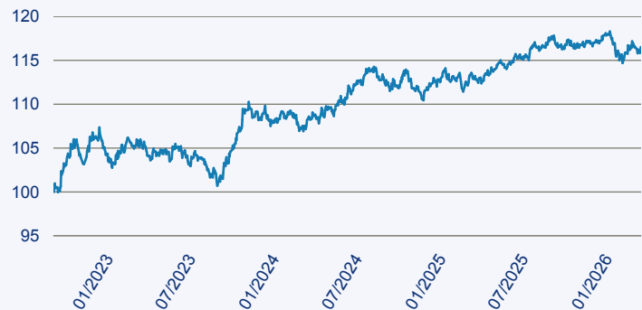
— Vanguard ESG Global Corporate Bond Index Fund EUR Hedged Acc

Risiko: Die in der Vergangenheit erzielte Performance und die Erträge lassen keinen Rückschluss auf die zukünftige Performance und die Erträge des Fonds zu. Der Fonds ist weder mit einer Garantie noch mit einem Kapitalschutzmechanismus ausgestattet. Der in Euro umgerechnete Wert internationaler Anlagen des Fonds kann infolge von Wechselkursschwankungen (Währungsschwankungen) sowohl steigen als auch sinken. Der Wert des Fonds und damit der Wert ihres Investments kann gegenüber dem Einstandspreis steigen oder fallen.