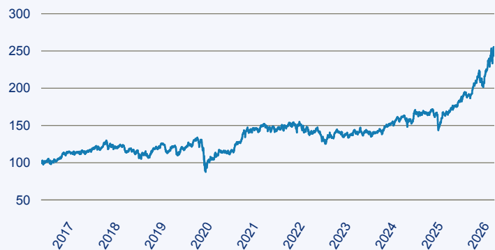
— Dimensional Funds - Emerging Markets Large Cap Core Equity Fund EUR Acc

Risiko: Die in der Vergangenheit erzielte Performance und die Ertrage lassen keinen Ruckschluss auf die zukunftsige Performance und die Ertrage des Fonds zu. Der Fonds ist weder mit einer Garantie noch mit einem Kapitalschutzmechanismus ausgestattet. Der in Euro umgerechnete Wert internationaler Anlagen des Fonds kann infolge von Wechselkursschwankungen (Wahrungsschwankungen) sowohl steigen als auch sinken. Der Wert des Fonds und damit der Wert ihres Investments kann gegenuber dem Einstandspreis steigen oder fallen.