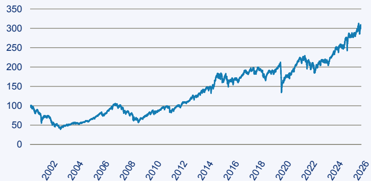
— Invesco Sustainable Pan European Systematic Equity Fund A Acc EUR

Risiko: Die in der Vergangenheit erzielte Performance und die Erträge lassen keinen Rückschluss auf die zukünftige Performance und die Erträge des Fonds zu. Der Fonds ist weder mit einer Garantie noch mit einem Kapitalschutzmechanismus ausgestattet. Der in Euro umgerechnete Wert internationaler Anlagen des Fonds kann infolge von Wechselkursschwankungen (Währungsschwankungen) sowohl steigen als auch sinken. Der Wert des Fonds und damit der Wert ihres Investments kann gegenüber dem Einstandspreis steigen oder fallen.