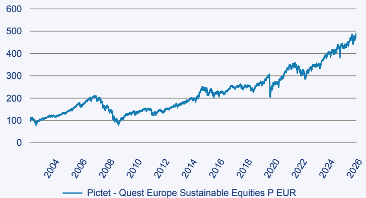
— Pictet - Quest Europe Sustainable Equities P EUR

Risiko: Die in der Vergangenheit erzielte Performance und die Erträge lassen keinen Rückschluss auf die zukünftige Performance und die Erträge des Fonds zu. Der Fonds ist weder mit einer Garantie noch mit einem Kapitalschutzmechanismus ausgestattet. Der in Euro umgerechnete Wert internationaler Anlagen des Fonds kann infolge von Wechselkursschwankungen (Währungsschwankungen) sowohl steigen als auch sinken. Der Wert des Fonds und damit der Wert ihres Investments kann gegenüber dem Einstandspreis steigen oder fallen.