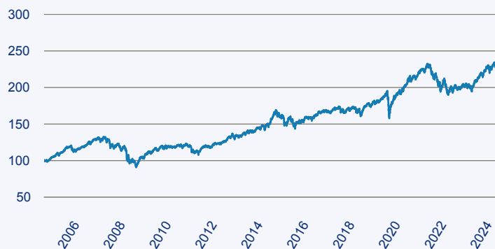
— Swisscanto (LU) Portfolio Fund Sustainable Balanced (EUR) AT

Risiko: Die in der Vergangenheit erzielte Performance und die Erträge lassen keinen Rückschluss auf die zukünftige Performance und die Erträge des Fonds zu. Der Fonds ist weder mit einer Garantie noch mit einem Kapitalschutzmechanismus ausgestattet. Der in Euro umgerechnete Wert internationaler Anlagen des Fonds kann infolge von Wechselkursschwankungen (Währungsschwankungen) sowohl steigen als auch sinken. Der Wert des Fonds und damit der Wert ihres Investments kann gegenüber dem Einstandspreis steigen oder fallen.