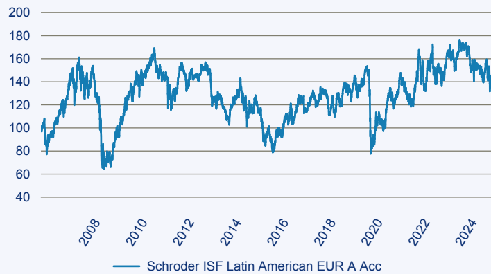
— Schroder ISF Latin American EUR A Acc

Risiko: Die in der Vergangenheit erzielte Performance und die Ertrage lassen keinen Ruckschluss auf die zukunftige Performance und die Ertrage des Fonds zu. Der Fonds ist weder mit einer Garantie noch mit einem Kapitalschutzmechanismus ausgestattet. Der in Euro umgerechnete Wert internationaler Anlagen des Fonds kann infolge von Wechselkursschwankungen (Wahrungsschwankungen) sowohl steigen als auch sinken. Der Wert des Fonds und damit der Wert ihres Investments kann gegenuber dem Einstandspreis steigen oder fallen.