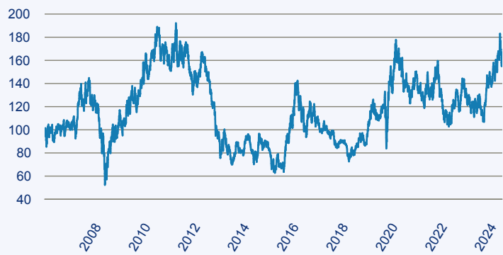
— BlackRock Global Funds - World Gold Fund D2 EUR

Risiko: Die in der Vergangenheit erzielte Performance und die Ertrage lassen keinen Ruckschluss auf die zukunftige Performance und die Ertrage des Fonds zu. Der Fonds ist weder mit einer Garantie noch mit einem Kapitalschutzmechanismus ausgestattet. Der in Euro umgerechnete Wert internationaler Anlagen des Fonds kann infolge von Wechselkursschwankungen (Wahrungsschwankungen) sowohl steigen als auch sinken. Der Wert des Fonds und damit der Wert ihres Investments kann gegenuber dem Einstandspreis steigen oder fallen.