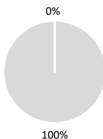
2. Taxonomiekonformität der Investitionen ohne Staatsanleihen*