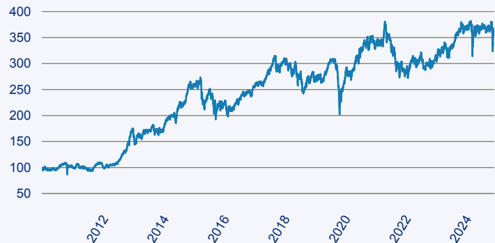
abrdrn SICAV I - Japanese Smaller Companies Sustainable Equity A Acc Hedged E

Risiko: Die in der Vergangenheit erzielte Performance und die Ertrage lassen keinen Ruckschluss auf die zukunftige Performance und die Ertrage des Fonds zu. Der Fonds ist weder mit einer Garantie noch mit einem Kapitalschutzmechanismus ausgestattet. Der in Euro umgerechnete Wert internationaler Anlagen des Fonds kann infolge von Wechselkursschwankungen (Wahrungsschwankungen) sowohl steigen als auch sinken. Der Wert des Fonds und damit der Wert ihres Investments kann gegenuber dem Einstandspreis steigen oder fallen.