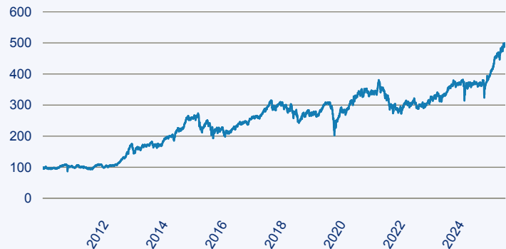
abrdrn SICAV I - Japanese Smaller Companies Sustainable Equity A Acc Hedged E

Risiko: Die in der Vergangenheit erzielte Performance und die Erträge lassen keinen Rückschluss auf die zukünftige Performance und die Erträge des Fonds zu. Der Fonds ist weder mit einer Garantie noch mit einem Kapitalschutzmechanismus ausgestattet. Der in Euro umgerechnete Wert internationaler Anlagen des Fonds kann infolge von Wechselkursschwankungen (Währungsschwankungen) sowohl steigen als auch sinken. Der Wert des Fonds und damit der Wert ihres Investments kann gegenüber dem Einstandspreis steigen oder fallen.