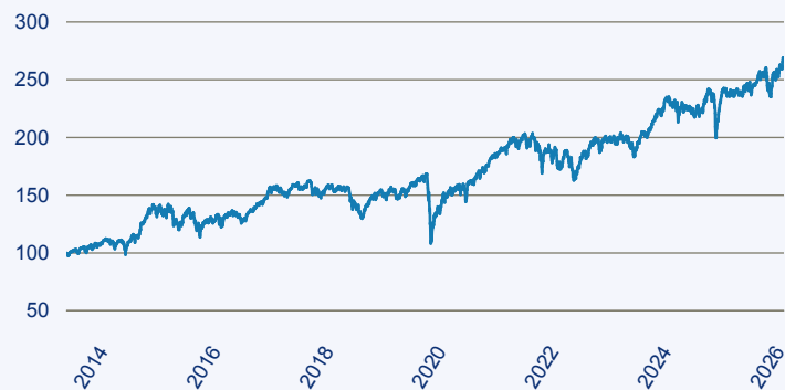
— Janus Henderson Horizon Fund - Pan European Mid and Large Cap Fund A2 EUR

Risiko: Die in der Vergangenheit erzielte Performance und die Erträge lassen keinen Rückschluss auf die zukünftige Performance und die Erträge des Fonds zu. Der Fonds ist weder mit einer Garantie noch mit einem Kapitalschutzmechanismus ausgestattet. Der in Euro umgerechnete Wert internationaler Anlagen des Fonds kann infolge von Wechselkursschwankungen (Währungsschwankungen) sowohl steigen als auch sinken. Der Wert des Fonds und damit der Wert ihres Investments kann gegenüber dem Einstandspreis steigen oder fallen.