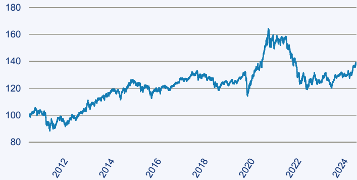
— Swisscanto (LU) Bond Fund Responsible Global Convertible ATH EUR

Risiko: Die in der Vergangenheit erzielte Performance und die Ertrage lassen keinen Ruckschluss auf die zukunftsige Performance und die Ertrage des Fonds zu. Der Fonds ist weder mit einer Garantie noch mit einem Kapitalschutzmechanismus ausgestattet. Der in Euro umgerechnete Wert internationaler Anlagen des Fonds kann infolge von Wechselkursschwankungen (Wahrungsschwankungen) sowohl steigen als auch sinken. Der Wert des Fonds und damit der Wert ihres Investments kann gegenuber dem Einstandspreis steigen oder fallen.