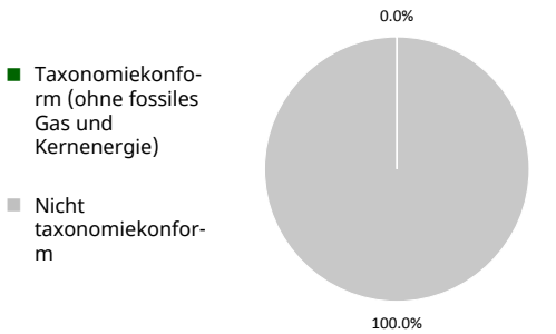
2. Taxonomiekonformität der Investitionen ohne Staatsanleihen*