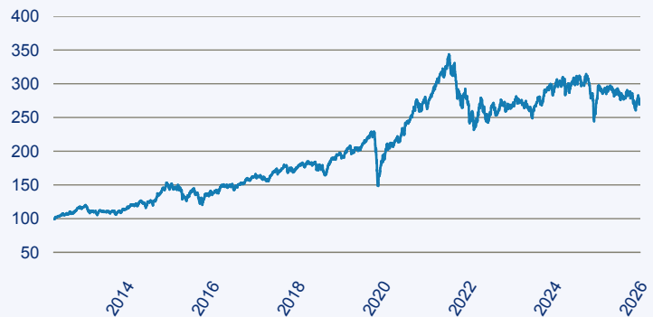
— abrdrn SICAV I - Global Small & Mid-Cap SDG Horizons Equity Fund A Acc EU

Risiko: Die in der Vergangenheit erzielte Performance und die Ertrage lassen keinen Ruckschluss auf die zukunftige Performance und die Ertrage des Fonds zu. Der Fonds ist weder mit einer Garantie noch mit einem Kapitalschutzmechanismus ausgestattet. Der in Euro umgerechnete Wert internationaler Anlagen des Fonds kann infolge von Wechselkursschwankungen (Wahrungsschwankungen) sowohl steigen als auch sinken. Der Wert des Fonds und damit der Wert ihres Investments kann gegenuber dem Einstandspreis steigen oder fallen.