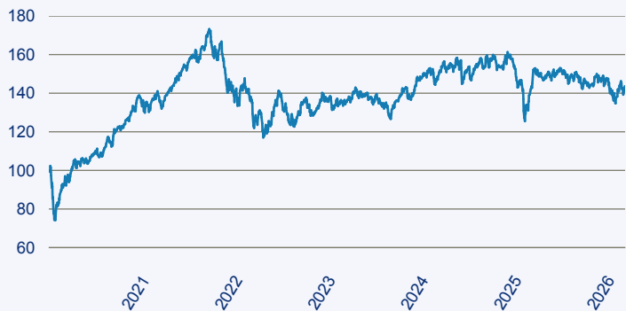
— abrdrn SICAV I - Global Small & Mid-Cap SDG Horizons Equity Fund X Acc EU

Risiko: Die in der Vergangenheit erzielte Performance und die Ertrage lassen keinen Ruckschluss auf die zukunftige Performance und die Ertrage des Fonds zu. Der Fonds ist weder mit einer Garantie noch mit einem Kapitalschutzmechanismus ausgestattet. Der in Euro umgerechnete Wert internationaler Anlagen des Fonds kann infolge von Wechselkursschwankungen (Wahrungsschwankungen) sowohl steigen als auch sinken. Der Wert des Fonds und damit der Wert ihres Investments kann gegenuber dem Einstandspreis steigen oder fallen.