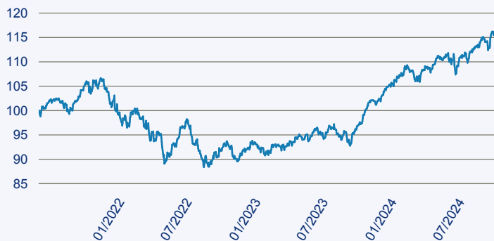
— Franklin ESG-Focused Balanced Fund R acc EUR

Risiko: Die in der Vergangenheit erzielte Performance und die Erträge lassen keinen Rückschluss auf die zukünftige Performance und die Erträge des Fonds zu. Der Fonds ist weder mit einer Garantie noch mit einem Kapitalschutzmechanismus ausgestattet. Der in Euro umgerechnete Wert internationaler Anlagen des Fonds kann infolge von Wechselkursschwankungen (Währungsschwankungen) sowohl steigen als auch sinken. Der Wert des Fonds und damit der Wert ihres Investments kann gegenüber dem Einstandspreis steigen oder fallen.