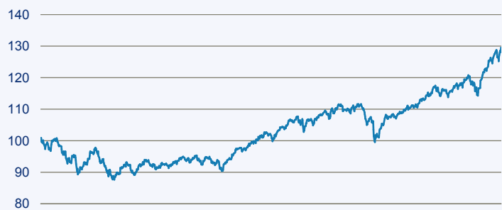
— Swisscanto (LU) Portfolio Fund - Sustainable Balanced (EUR) DT

Risiko: Die in der Vergangenheit erzielte Performance und die Erträge lassen keinen Rückschluss auf die zukünftige Performance und die Erträge des Fonds zu. Der Fonds ist weder mit einer Garantie noch mit einem Kapitalschutzmechanismus ausgestattet. Der in Euro umgerechnete Wert internationaler Anlagen des Fonds kann infolge von Wechselkursschwankungen (Währungsschwankungen) sowohl steigen als auch sinken. Der Wert des Fonds und damit der Wert ihres Investments kann gegenüber dem Einstandspreis steigen oder fallen.