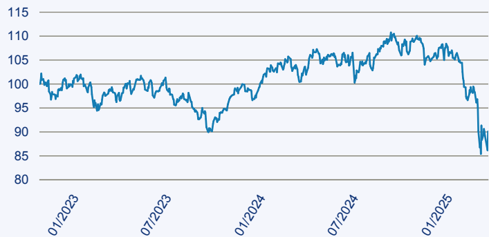
— abrdn SICAV II - Global Impact Equity Fund A Acc EUR

Risiko: Die in der Vergangenheit erzielte Performance und die Ertrage lassen keinen Ruckschluss auf die zukunftige Performance und die Ertrage des Fonds zu. Der Fonds ist weder mit einer Garantie noch mit einem Kapitalschutzmechanismus ausgestattet. Der in Euro umgerechnete Wert internationaler Anlagen des Fonds kann infolge von Wechselkursschwankungen (Wahrungsschwankungen) sowohl steigen als auch sinken. Der Wert des Fonds und damit der Wert ihres Investments kann gegenuber dem Einstandspreis steigen oder fallen.