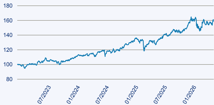
— JPM Middle East, Africa and Emerging Europe Opportunities A Acc EUR

Risiko: Die in der Vergangenheit erzielte Performance und die Erträge lassen keinen Rückschluss auf die zukünftige Performance und die Erträge des Fonds zu. Der Fonds ist weder mit einer Garantie noch mit einem Kapitalschutzmechanismus ausgestattet. Der in Euro umgerechnete Wert internationaler Anlagen des Fonds kann infolge von Wechselkursschwankungen (Währungsschwankungen) sowohl steigen als auch sinken. Der Wert des Fonds und damit der Wert ihres Investments kann gegenüber dem Einstandspreis steigen oder fallen.